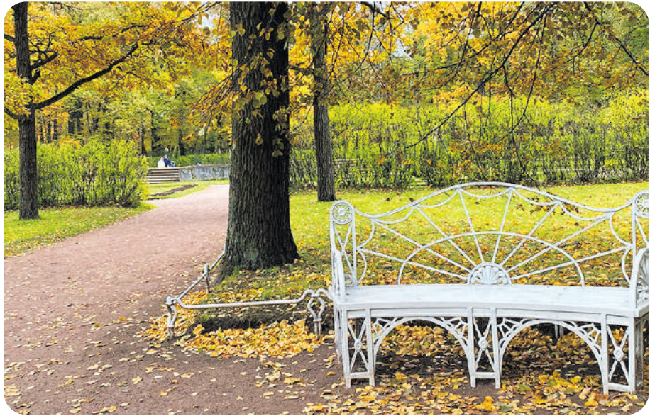
Павловский парк

Наведите порядок и на самом дачном участке. Для этого рекомендуем очистить участок от всего, что мог-