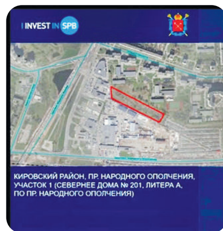
Фото презентации проекта